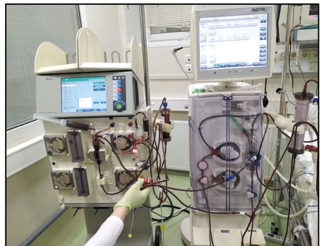
Рис. 3. Подключение гемофильтра и сорбционной колонки «Эфферон ЦТ» на двух аппаратах. Fig. 3. Connecting a hemofilter and a sorption apparatus "Efferon CT" with two devices.

Учитывая шок, метаболические нарушения, ОПП, начала высокообъемная вено-венозная гемодиализация (ГДФ), проведение которой в течение 2 ч не улучшило состояние больного. Принято решение об экстракорпоральной сорбции цитокинов. Поскольку проведение заместительной почечной терапии (ЗПТ) планировалось на более длительный срок, чем сорбция цитокинов, а, кроме того, скорость кровотока для высокообъемной ГДФ значительно больше, чем требуется для сорбции, использовано 2 независимых экстракорпоральных контура. ГДФ осуществлялась аппаратом 5008 (Fresenius Medical Care) через перфузионный катетер диаметром 12 Fr, скорость кровотока составляла 400 мл/мин. Для проведения сорбции в контур диализного аппарата 5008 в линию забора крови до гемофильтра подключен аппарат MultiFiltrate (Fresenius Medical Care), в контур которого подключена колонка для сорбции цитокинов «Эфферон ЦТ» (ООО «Нанолек», Россия), скорость кровотока в этом контуре 100 мл/мин. Возврат крови после гемосорбции осуществлялся в контур после гемофильтра перед воздушной ловушкой (рис. 3). Учитывая гипокоагуляцию, повышенную